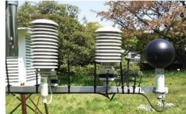
暑さ指数(WBGT)測定装置